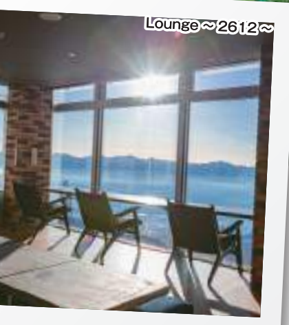
Lounge ~ 2612 ~

中央アルプス駒ヶ岳ロープウェイで行く標高2,612mの千畳敷は、今から約2万年前に、氷河により浸食されて形成されたカール(半円形の窪地)で、畳を1,000枚敷いた広さがあることから「千畳敷カール」と呼ばれています。夏の高山植物、秋の紅葉、冬の紺碧の空と雪景色など四季折々に魅力的な表情を見せてくれます。