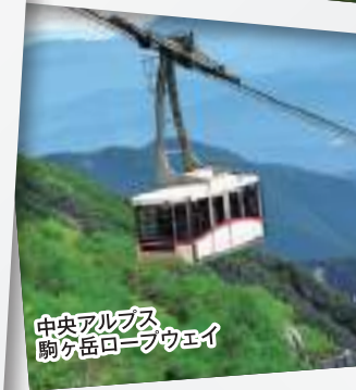
中央アルプス 駒ヶ岳ロープウェイ