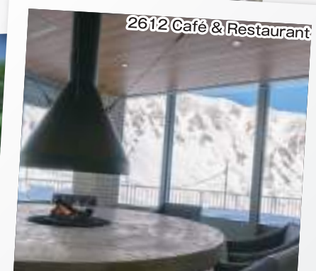
2612 Café & Restaurant